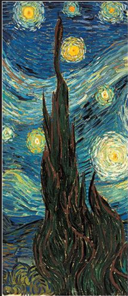
Մայրաքաղաք զինչը Վ.Մ.Մ.Տ.Ր.Վ.Ս.Ն. 1889 Կառված թղթաշերտով 737 x 921 սմ Մասնավորապես պահպանված, կարծես Չեք է ընդհանրապես ընդհանրապես 42294